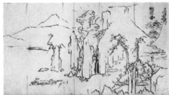
図1 桃源図下絵 狩野山雪筆

す。この作品は、紙本墨画、縦31.5センチ、横122.8センチの一枚の紙に描かれています。画面の右半分は陸の景色、左半分は川の景色であり、現在は掛幅になっていますが、あるいは元は画卷であったとも考えられます。