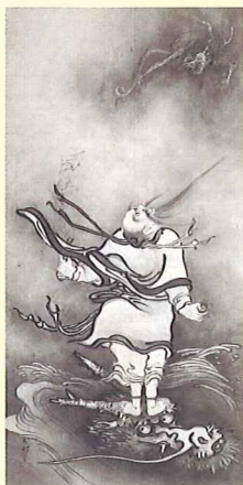
重要文化財／呂洞賓図 雪村周継筆 室町時代

雪村周継の作品七件を始め、可翁や文清、狩野元信など、当館が所蔵する日本水墨画の名品が一堂に揃います。