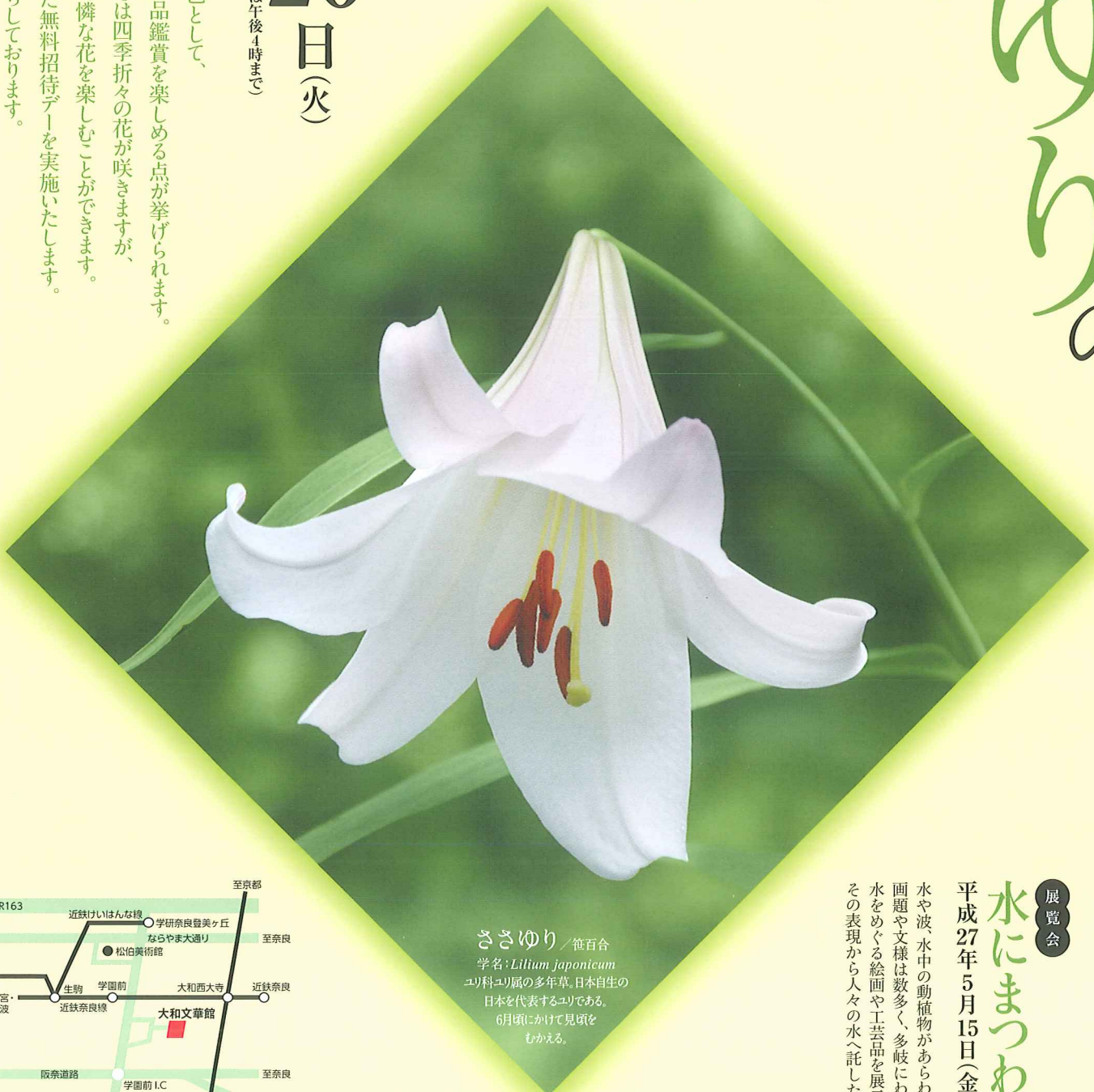
ささゆり / 笹百合 学名: Lilium japonicum ユリ科ユリ属の多年草。日本自生の日本を代表するユリである。6月頃にかけて見頃をむかえる。

大和文華館の大きな特色として、豊かな自然環境の中で作品鑑賞を楽しめる点が挙げられます。建物を取り囲む文華苑では四季折々の花が咲きますが、この時期にはささゆりの可憐な花を楽しむことができます。このたび、ささゆりに因んだ無料招待デーを実施いたします。みなさまのご来館をお待ちしております。