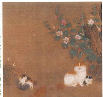
重要文化財 伝毛益筆「蜀葵遊猫図」中国・南宋時代

※開花状況は、天候に左右されます。何卒ご了承くださいませよう、お願い申し上げます。