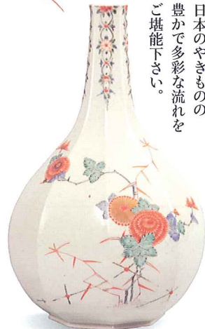
色絵菊花文八角瓶 日本・江戸時代

●平成27年7月3日(金)～8月16日(日) 縄文時代から江戸時代にかけての、日本のやきものの豊かで多彩な流れをご堪能下さい。