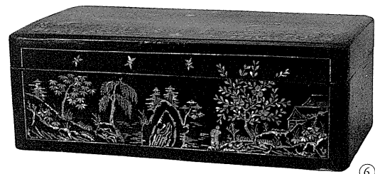
1. 螺鈿葡萄葉風文箱 中国・明時代 東京国立博物館蔵 2. 重要文化財 銅板地螺鈿花鳥文説相箱 平安時代 大和文華館蔵 3. 葡萄図 李維結筆 朝鮮時代 大和文華館蔵 4. 螺鈿花鳥文視箱 中国・明時代 東京国立博物館蔵 5. 螺鈿葡萄文衣裳箱 朝鮮時代 東京国立博物館蔵 6. 螺鈿山水文箱 朝鮮時代 個人蔵