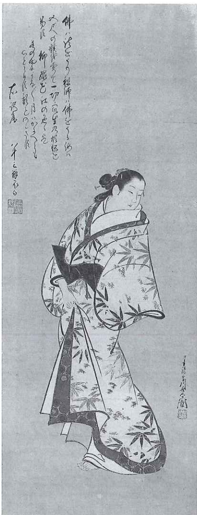
【重要美術品】美人図 宮川長春筆 江戸時代中期