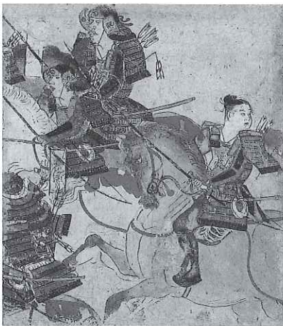
平治物語絵巻断簡 六波羅合戦巻 鎌倉時代