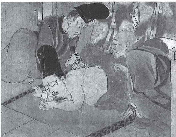
病草紙断簡 平安時代後期