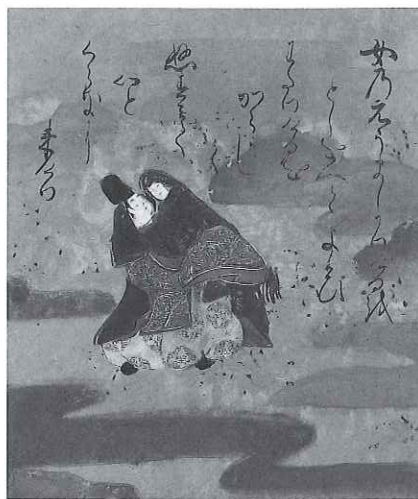
伊勢物語図色紙 六段芥川 伝依屋宗達筆 江戸時代前期

The exhibition comprises Japanese paintings depicting human figures. We recommend giving close attention to the emotions expressed on their faces.