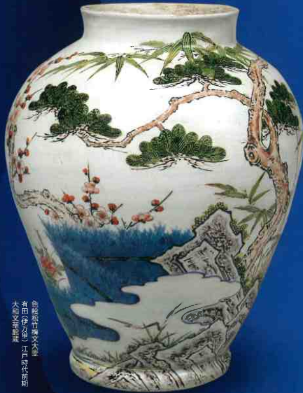
色絵松竹梅文大壺 有田(伊万里) 江戸時代前期 大和文華館蔵