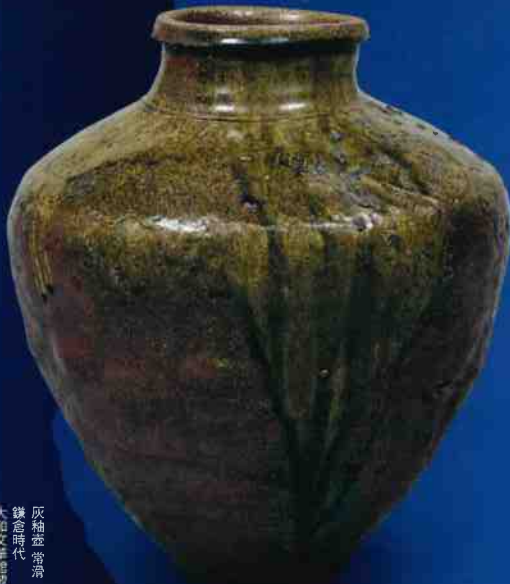
灰釉壺常滑 鎌倉時代 大和文華館蔵

The Pottery of Japan: From Jomon Earthenware to Modern Kyo Ware