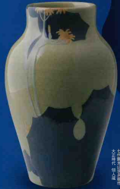
青磁石講文壺 七代徳光山善兵衛作 大正時代 個人蔵