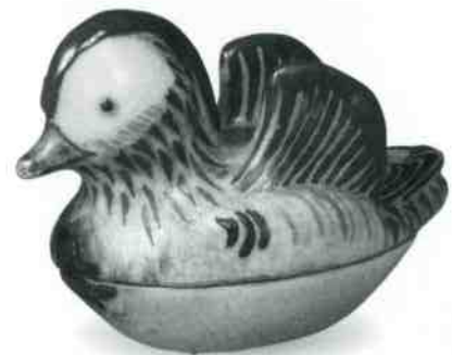
色絵おしどり香合 野々村仁清作 大和文華館蔵