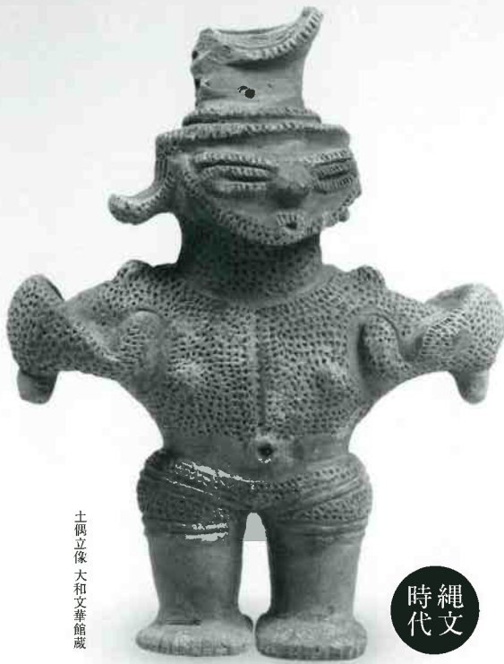
土偶立像 大和文華館蔵

本展観では、館蔵の縄文時代から江戸時代までのやきものと、特別出陳の近代京焼を展示します。日本のやきもの悠久の歴史とあくなき創造にご注目ください。