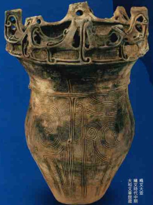
縄文大壺 縄文時代中期 大和文華館蔵