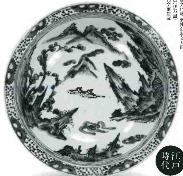
重要文化財 伊万里 有田伊万里 大和文華館蔵