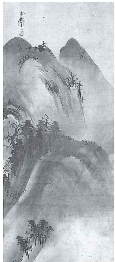
樓閣山水図 雪村筆 大和文華館蔵 山々が、むくむくとうごめく、命あるもののようにみえてきます。