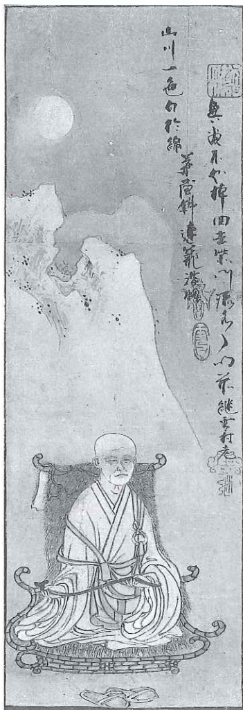
自画像(重要文化財) 雪村筆 大和文華館蔵 雪の月夜に、不機嫌な表情で何を思っているか。晩年の自画像と考えられています。

宮女図屏風(部分) 雪村筆 京都国立博物館蔵 雪村のレパトリーに、こうした唐美人図も入っていたとは意外な気がします。しかし、室町時代の禅僧が唐美人図によせた賛詩は数多く、人気の画題のひとつでした。