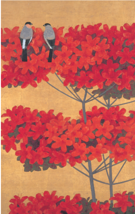
上村松篁 「つつじ」 昭和37年頃