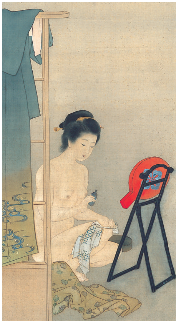
上村松園 「化粧」(部分) 明治33年頃