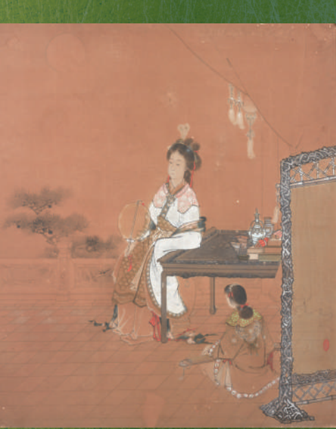
上村松園 「唐美人」(衝立)

〔休館日〕月曜日(ただし、月曜日が祝日、休日の場合は開館し、翌火曜日が休館) 〔開館時間〕10時～17時(入館は16時まで) 〔入館料〕大人(高校生・大学生を含む)820円、小学生・中学生410円 〔主催〕公益財団法人 松伯美術館