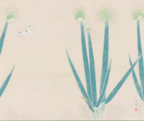
上村松篁 「ねぎぼうず」