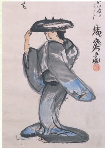
富岡鉄斎 「筑摩神事図」(部分)