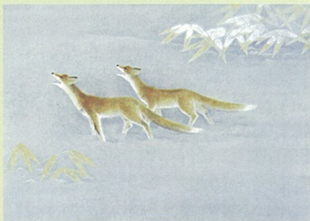
「初めての冬」平成5年