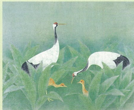
「剣路原の春」平成20年