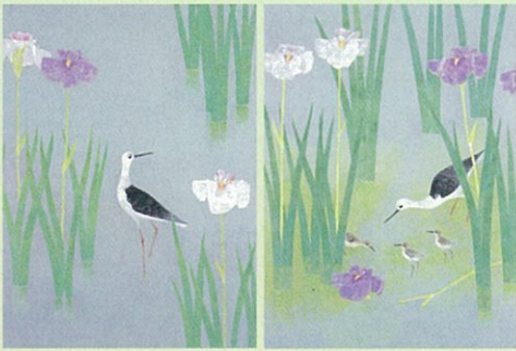
「花の水辺I・II」平成18年