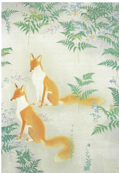
上村松篁 「早秋」 昭和16年(1941)