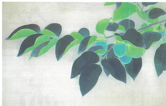
上村松篁 「青柿」 昭和22年(1947)