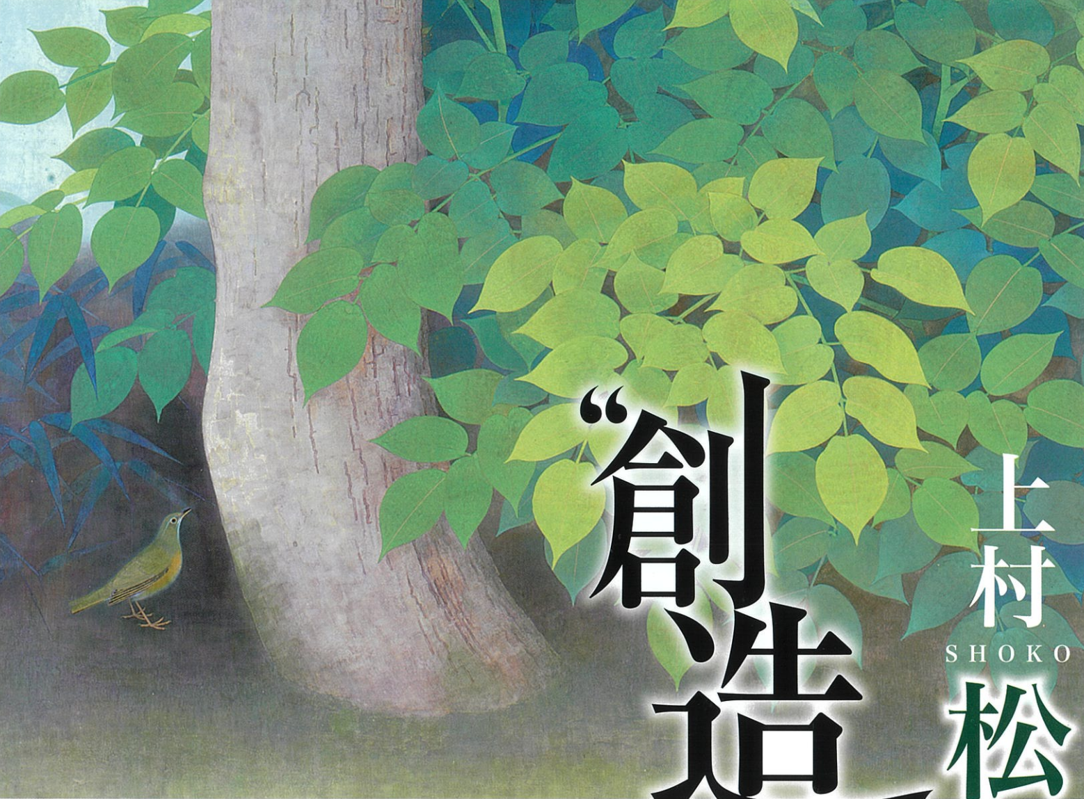
上村松篁 「樹蔭」 昭和23年(1948) 第1回創造美術展