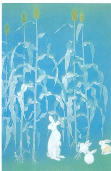
上村松篁 「月夜」 昭和14年(1939)