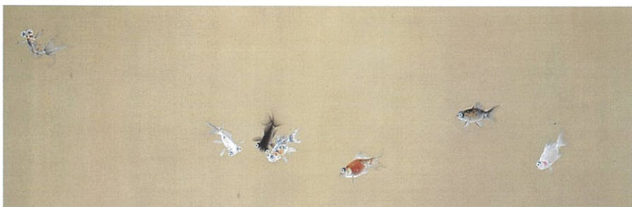
上村松篁 「金魚」 昭和4年(1929)