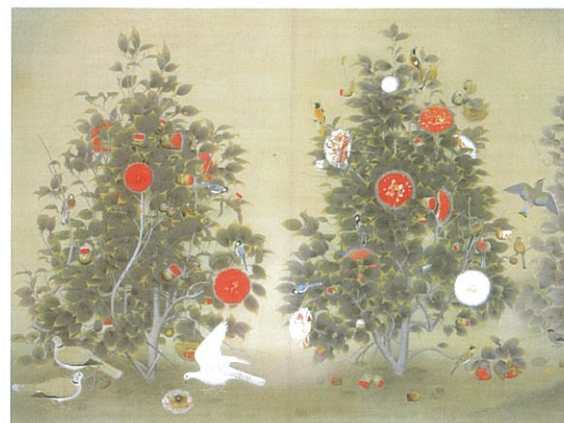
上村松篁 「春園鳥語」 昭和4年(1929)