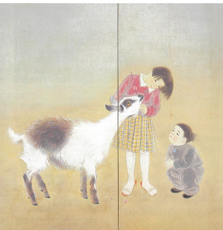
上村松篁 「羊と遊ぶ」 昭和13年(1938) 第11回青甲社展