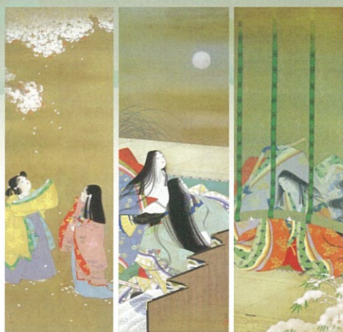
上村松園「雪月花」 昭和12年 宮内庁三の丸尚蔵館蔵

伯美術館は1994年(平成6年)に、上村家からの作品の寄贈と近畿日本鉄道株式会社(当時)からの基金出損により開館いたしました。2019年、お陰様で開館25周年を迎えます。松園、松篁、淳之三代の画業を紹介し、また日本画に対するご理解と発展を目的とした公募展なども重ねて参りました。特に、大切に保管されていた松園、松篁の下絵や素描類からは、画家の感性や勤勉な制作姿勢が如実に伝わってきます。衣食住に深く関わる女性の生活を愛おしみ、日常を丁寧に美しく生きるとして大切な生き様を美人画に託し表現し続けた松園。大好きな鳥や花、様々な生き物たちと真摯に向き合い、自然との一体感から得た「共生」という慈愛に満ちた世界観を描き続けた松篁。お互いの絵について教え合うことは一切なかったそうです。が、真善美を求め、格調高く清らかな浄土へ導くような芸術世界を追求する姿勢はふたりに共通しています。作品に込められたこの普遍的な祈りのメッセージは、これからも多くの鑑賞者に届けられることでしょう。本展では記念展にふさわしく松園の「序の舞」をはじめ代表作を、ご覧いただけます。今回の特別展は、開館25周年の記念展として、また、日本人と日本の風土に育まれた美しい文化として、日本画が広く未来に受け継がれていくことも切に願ひ企画いたしました。「日本画の心」をご堪能いただければ幸いです。