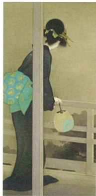
上村松園「待月」 大正15年 京都市美術館蔵