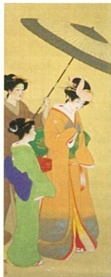
上村松園「春」 昭和13年 個人蔵