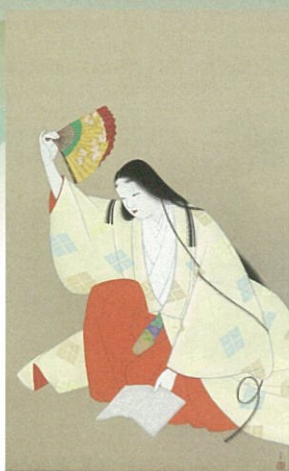
上村松園「草紙洗小町」 昭和12年 東京藝術大学蔵