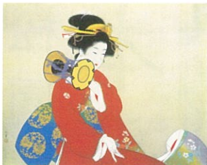
上村松園「鼓の音」 昭和15年 松伯美術館蔵