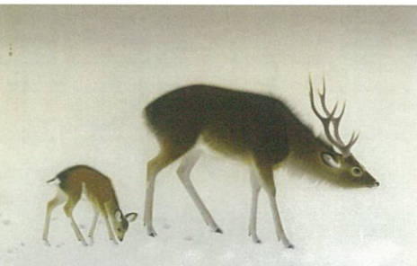
上村松篁「山鹿」 昭和11年 京都市美術館蔵