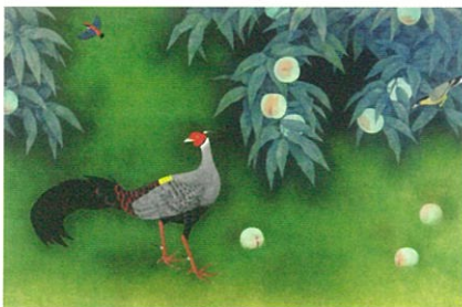
上村松篁「樹下幽禽」 昭和41年 日本芸術院蔵