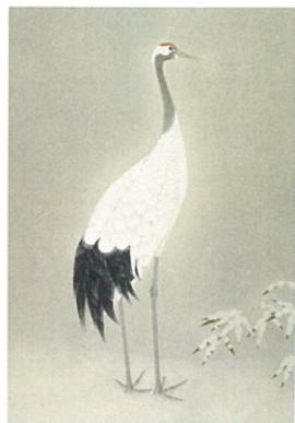
上村松篁「丹頂」 昭和55年 松伯美術館蔵