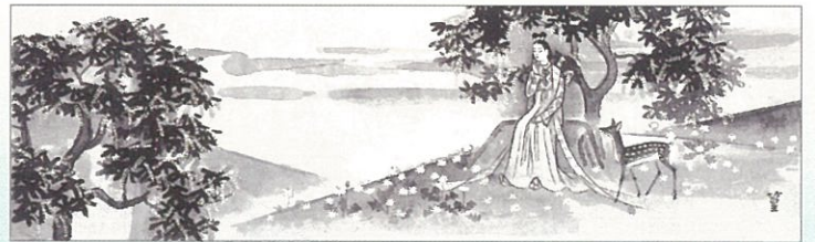
上村松篁(額田女王挿絵原画)第3章・6

万葉の歌は、時を越えて歌い継がれ今日でも多くの人々に愛されています。人々の純粋で繊細な感情や自然と向きあう真摯な姿は歌の中で生き生きと力強く、また優雅に表現されています。日本画家上村松篁も、おほかたで心豊かな万葉の世界に憧れ、若い頃から万葉歌を愛読し、自らの絵の制作の糧としてきました。 本展では、昭和43年1月から昭和44年3月にわたり「サンデー毎日」に連載された井上靖氏作の歴史小説「額田女王」に添えた松篁の挿絵原画124点を、物語を追いながら各場面で歌われる万葉歌とともに展示します。登場人物の豊かな感情や彼らをとりにかこむ四季折々の美しい自然は、墨の濃淡によって簡潔かつ繊細に表現され、臨場感にあふれています。また、松篁の描いた万葉の世界の集大成ともいえる超大作「万葉の春」や、万葉歌に歌われている鳥や花を描いた松篁・淳之の花鳥画もあわせてご覧頂き、しばし悠久の時をお楽しみいただければ幸いです。