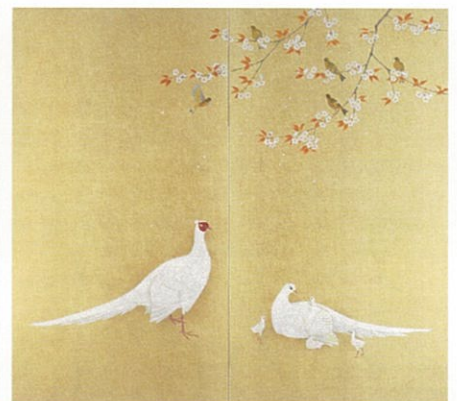
上村淳之「四季花鳥園(春・秋)」平成10年