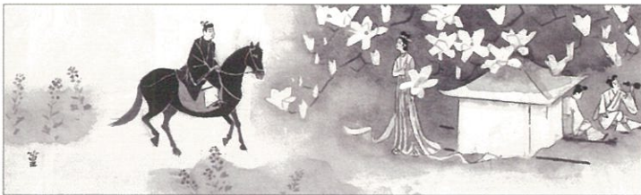
上村松篁(額田女王挿絵原画)第6章・10