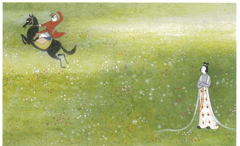
茜さす 紫野行き しめ野行き 野守は見ずや 君が袖振る 額田女王