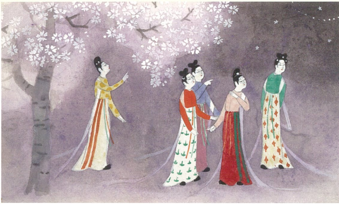
上村松篁(額田女王)屏絵「水城」