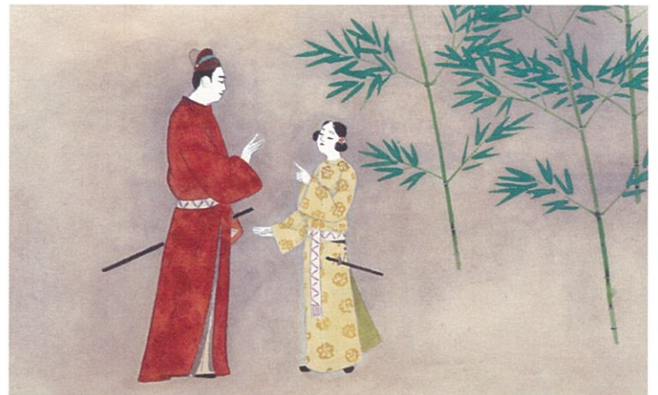
上村松篁(額田女王)屏絵「白い雫」