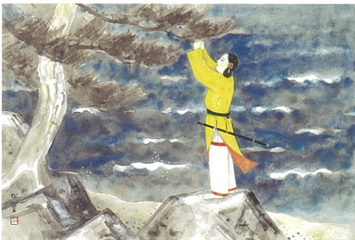
磐白の浜松が枝を 引き結び 真幸くあらば また還り見む 有間皇子