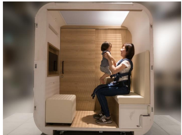
ベビーケアルーム室内