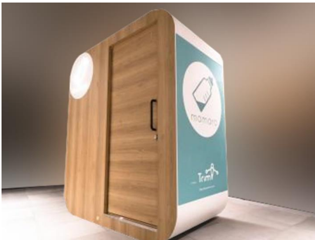
ベビーケアルーム外観