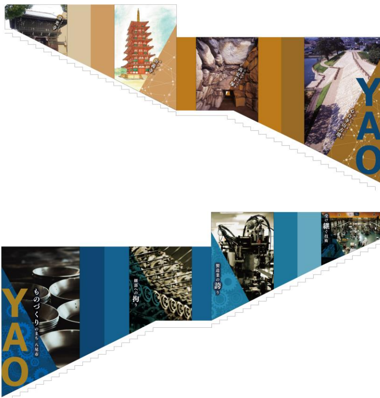
<施工後の近鉄八尾駅構内 東階段> (イメージ)