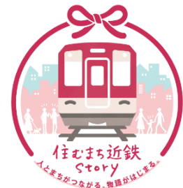
<住むまち近鉄 Story ロゴ>

近鉄では、「地域やそこで暮らす人々との共生」をテーマに、「もっとずっと、親しまれ、愛され」、住まいとして選ばれる沿線でありたい」という思いから沿線それぞれの地域が持つ多様な魅力を発掘し、それを地域の方と一緒に広く届ける取り組みを2021年9月から「住むまち近鉄 story」として実施しています。