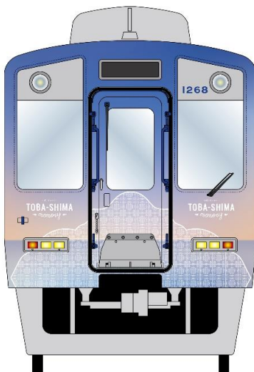
【外装正面（イメージ）】