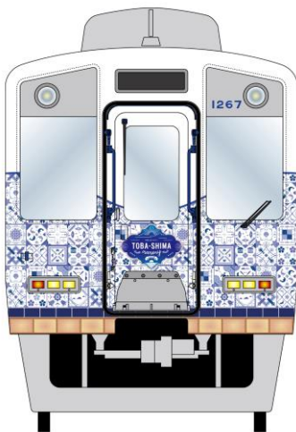
【外装正面（イメージ）】