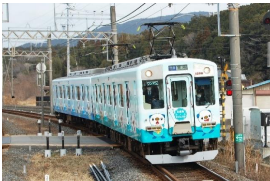
ミジュマルトレイン