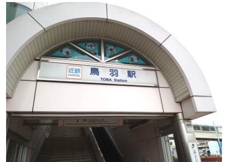
鳥羽駅構内などのミジュマルの装飾