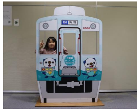
ミジュマルトレイン スタンドパネル