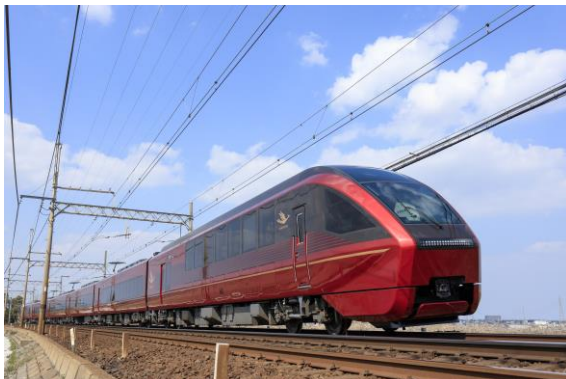
名阪特急「ひのとり」