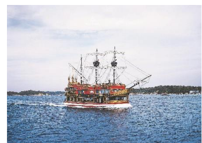
賢島エスパーニャクルーズ