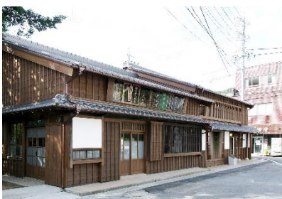
鳥羽大庄屋かどや

2016年に「G7伊勢志摩サミット」が開催された「志摩観光ホテル」や「賢島宝生苑」など、英虞湾の美しいリアス海岸を望み、豊かな海の幸が味わえるホテルや旅館が数多くあります。美しい英虞湾を遊覧できる遊覧船が発着する賢島港もほど近く、賢島駅構内には伊勢志摩サミット記念館「サミエール」があります。