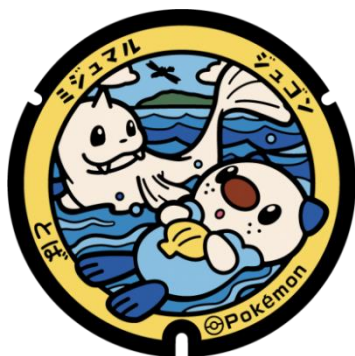
鳥羽市 ミジュマルとジュゴンのポケふた

みえ応援ポケモンの「ミジュマル」と三重県内のさまざまな景観をイメージして描かれた『ポケふた』が県内7市（四日市市、津市、伊勢市、鳥羽市、志摩市、伊賀市、熊野市）に設置されています（熊野市は5月下旬ごろに設置予定）。このうち、鳥羽市はドルフィン公園（三重県鳥羽市鳥羽一丁目2383-42）に、志摩市は八幡さん公園（三重県志摩市大王町波切 110-3）に設置されています。