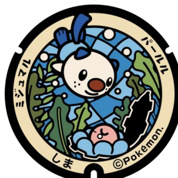
志摩市 ミジュマルとパールルのポケふた

©2022 Pokémon. ©1995-2022 Nintendo/Creatures Inc./GAME FREAK inc.