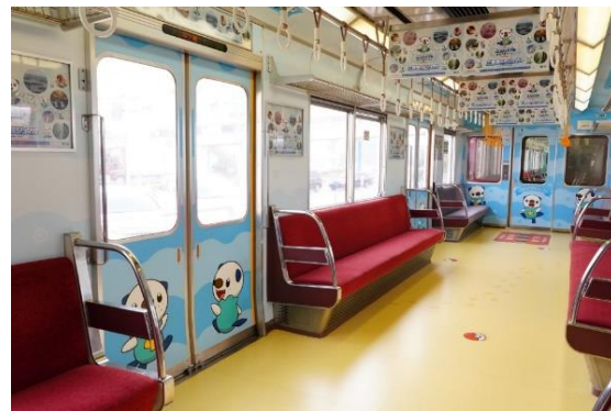
ミジュマルトレイン車内