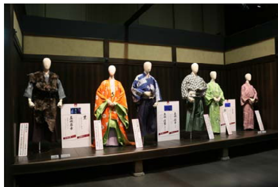
信州上田真田丸大河ドラマ館 エントランス(左)と内部(右)