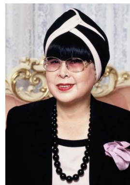
YUMI KATSURA Paris