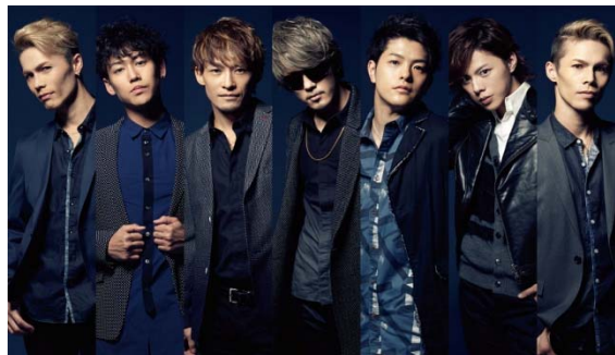
ダンス・ボーカルグループ「BRIDGET」

また、8月1日に開催された桂由美ブライダルファッションショー「Tokai Bridal FES 2015」にゲスト出演し、10月7日にシングルとしてリリースする桂由美監修、全日本ブライダル協会推奨、恋人の聖地公式ウエディングソング「君だけ愛してる」を初披露した。