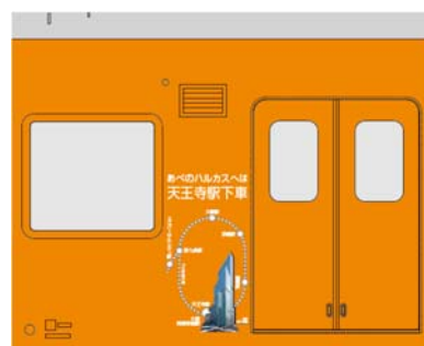
④ JR大阪環状線からのアクセス イメージ