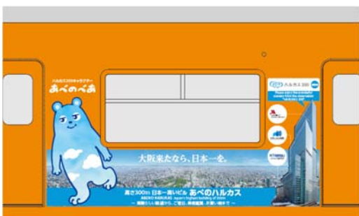
③ あべのべあ + 展望台（昼景）+ビル全景 +各施設ロゴマーク イメージ