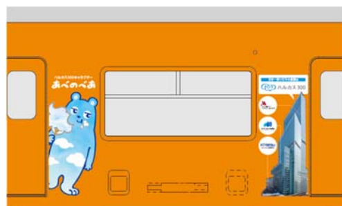
② あべのべあ +ビル全景 +各施設ロゴマーク イメージ