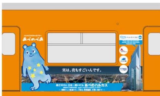
① あべのべあ + 展望台（夜景）+ビル全景 +各施設ロゴマーク イメージ