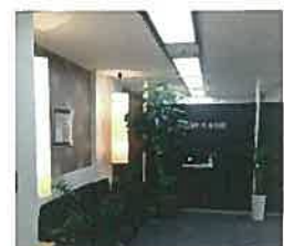
近鉄の仲介 梅田営業所(大阪市北区)