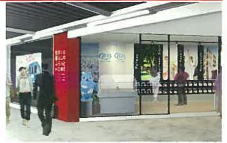
【近鉄電車ホーム直結店舗出入口イメージ(拡大)】

本店舗の2階は、近鉄学園前駅大阪方面ホームと直結しており、近鉄グループ情報コーナーまではホームからの入店が可能です。 また、ホームに大型デジタルサイネージを設置し、「あべのハルカス」への誘客を図るなど、グループ各社の最新情報をお届けします