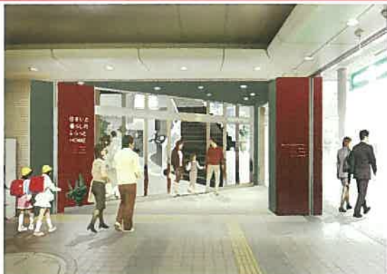
【学園前駅南口改札横エントランスイメージ】