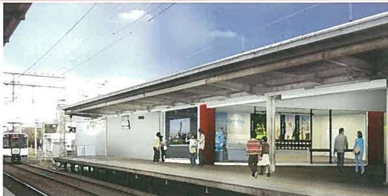
【近鉄電車ホーム直結店舗出入り口イメージ】