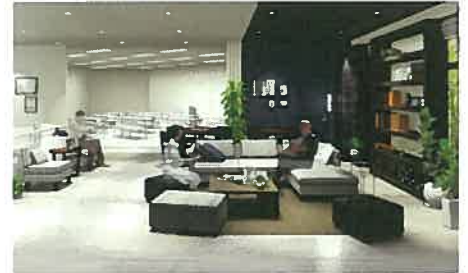
【2階インテリアラボラトリーイメージ】

1階ではオーダーキッチンなどオンリーワンの住まいをご提案でき、建築・インテリア関係書籍もご用意しています。また、リフォームに特化したコーナーで最新のユニットバスや実際に使用できるトイレを展示しております。 2階ではインテリアに特化し、カーテンの展示や建築・インテリア関係書籍をご用意し、インテリアコーディネート楽しさを体感いただけます。