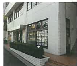
近鉄の仲介 東生駒営業所(奈良県生駒市)