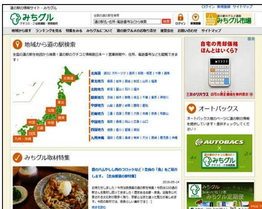
<みちぐるサイトイメージ>

また、これまでの道の駅運営者や自治体向けのサービスに加えて、KNTの顧客である企業・学校や地域観光事業者向けに、道の駅とKNT顧客、道の駅と利用者の双方を結びつけるサービスを始めます。道の駅へ進出したい企業向けには商品の販売支援、地域密着を目指す企業・自治体・地域観光事業者向けには道の駅でのリアルプロモーション企画運営、学校向けには道の駅を活用した学習者参加型プログラムの企画運営を始めます。KNT、XS両社の保有リソースを相互補完することで地域誘客交流事業を推進していきます。