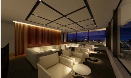
スカイラウンジ完成予想図