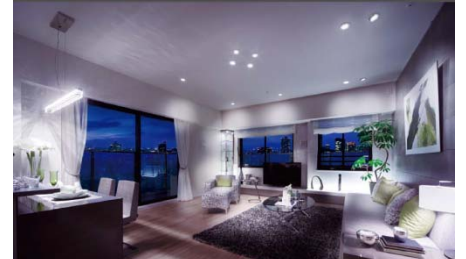
モデルルーム写真(Htype71.23㎡)