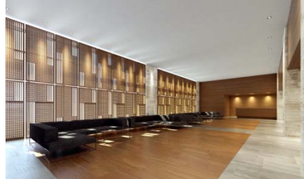
オーナーズホール完成予想図