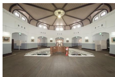
旧奈良監獄舎房 中央看守所