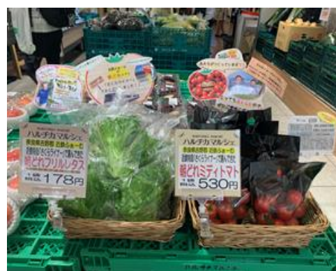
「さくらライナー」での貨客混載輸送と「ハルチカマルシェ」での販売の様子（イメージ）