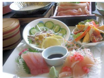
夕食：豆乳しゃぶしゃぶ (イメージ)