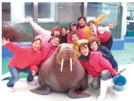
ふれあい水族館 二見シーパラダイス