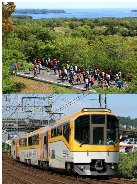
専用臨時列車「走りゃんせ号」(イメージ)