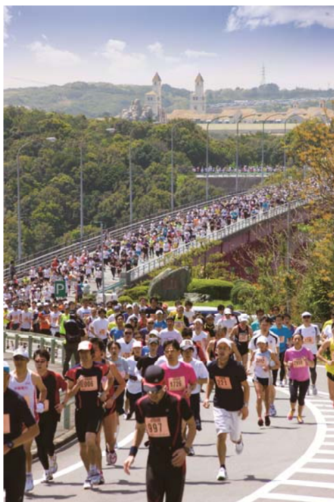
「志摩ロードパーティ」走行コースの一部

近鉄では、さらに多くの皆様に、大会参加を通じて志摩の景観や美食に触れていただき、何度も訪れたい観光地として、伊勢志摩の魅力を感じていただければと考えています。