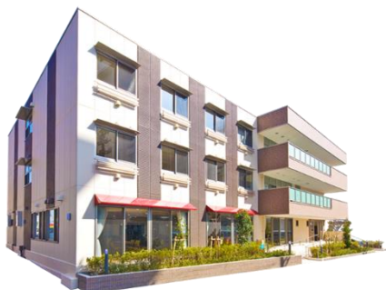
ウェルスマイル八戸ノ里 (高齢者向け住宅)