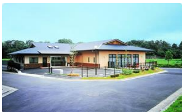
北登美ヶ丘ケアセンター