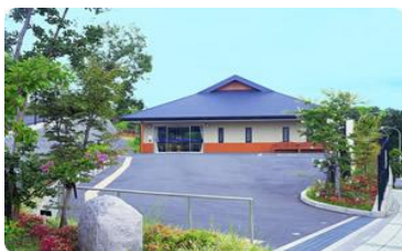
あやめ池ケアセンター