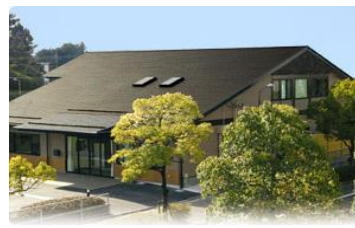
桔梗が丘ケアセンター