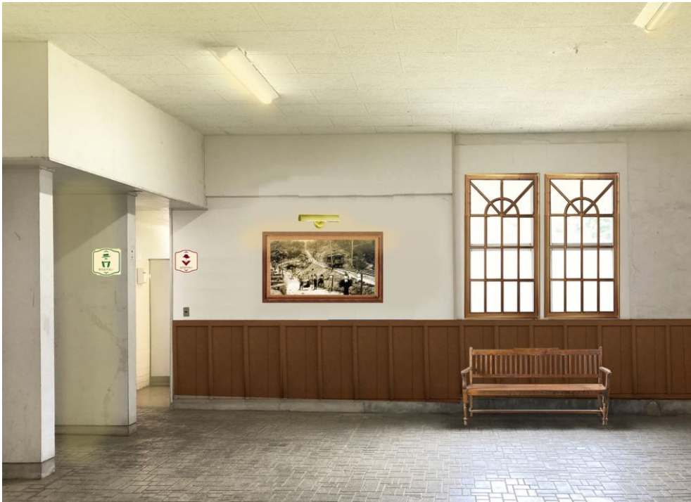
<リニューアル後の宝山寺駅構内>（イメージ）