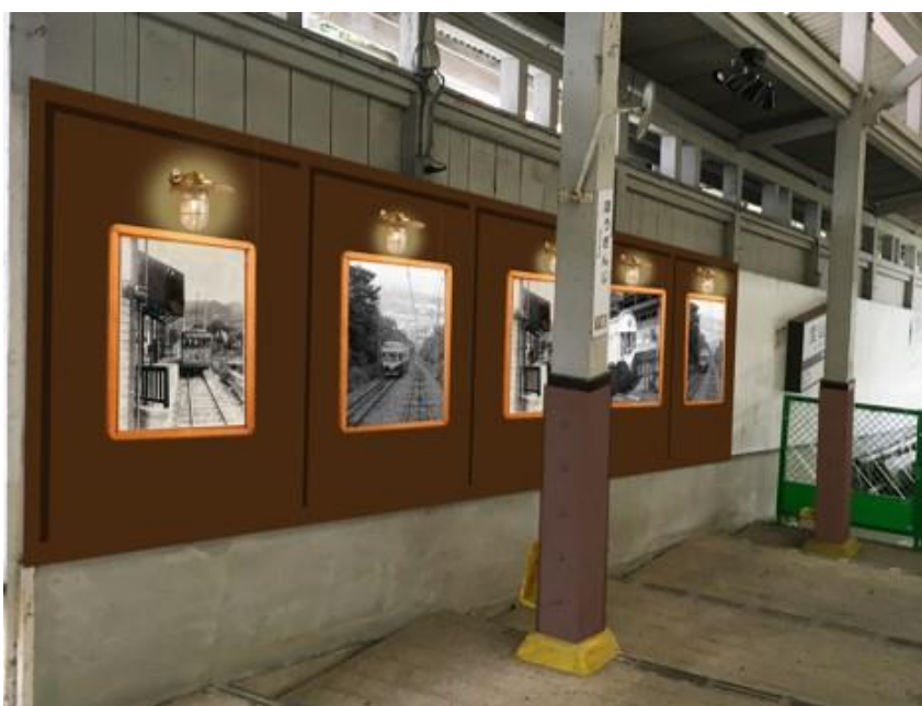
＜リニューアル後の宝山寺駅構内＞（イメージ）