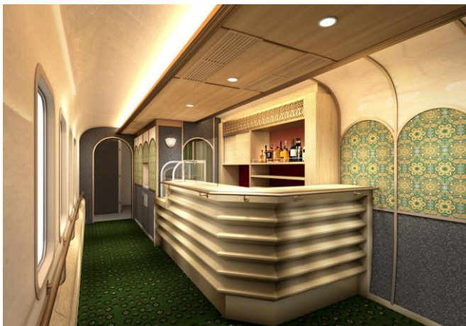
販売カウンター（イメージ）