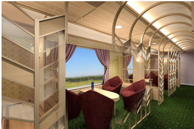
【2号車】 サロンシート（イメージ）