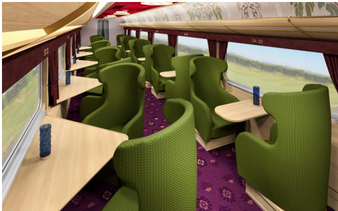
【1・3・4号車】 ツインシート（イメージ）

2名用のツインシートと、3～4名用のサロンシート2種類をご用意しており、ゆったりとおくつろぎいただけます。