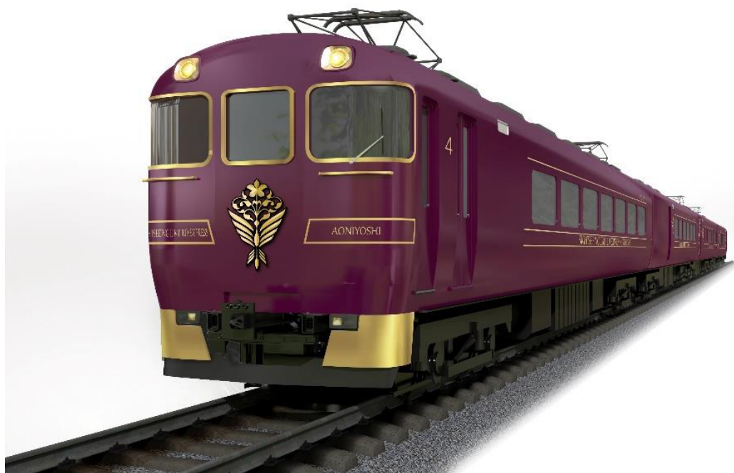
観光特急「あをによし」外観イメージ