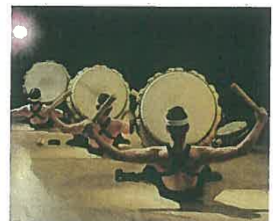
太鼓芸能集団「鼓童」(イメージ)

クラブツーリズムは、クルーズ旅行をより多くの方に楽しんでいただけるよう、出会い、感動に満ち溢れ、旅仲間との絆も深められる旅を積極的に展開してまいります。 (ツアー行程、概要については、次頁・別紙をご参照ください)