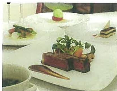
洋食(夕食イメージ)