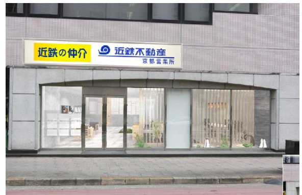
京都営業所 完成予想パース

名 称： 近鉄の仲介 京都営業所 所 在 地： 京都市中京区烏丸通二条下る秋野々町513 (京都第一生命泉屋ビル1F) 交 通： 京都市営地下鉄烏丸線・東西線 「烏丸御池」駅 徒歩3分 営業開始日： 2016年3月12日（土） 営業時間： 9:30~18:20 定 休 日： 水曜日および第2・3木曜日 問 合 せ： TEL：075-255-3133 FAX：075-255-3136 711コール：0120-911-809 E-mail：e-kyouto@kintetsu-re.co.jp