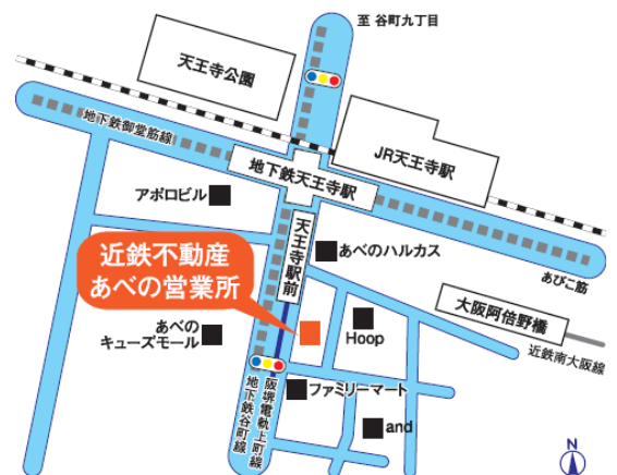
あべの営業所 位置図