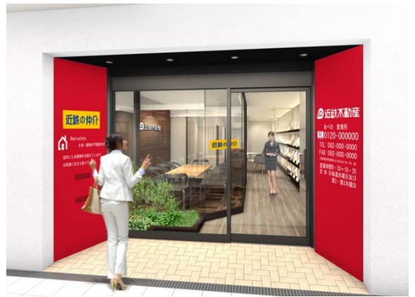
あべの営業所 完成予想パース

名 称： 近鉄の仲介 あべの営業所 所 在 地： 大阪市阿倍野区阿倍野筋1-45-7 交 通： 近鉄南大阪線「大阪阿部野橋」駅 徒歩2分 大阪市営地下鉄各線「天王寺」駅 徒歩2分 JR各線「天王寺」駅 徒歩3分 営業開始日： 2016年3月12日（土） 営業時間： 9:30~18:20 定 休 日： 水曜日および第2・3木曜日 問 合 せ： TEL：06-6627-0032 FAX：06-6627-0036 711コール：0120-977-606 E-mail：e-abeno@kintetsu-re.co.jp