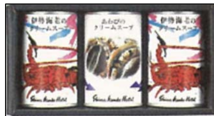
「志摩観光ホテル伊勢海老のクリームスープ&あわびクリームスープセット」