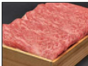
「伊勢神宮奉納 松阪牛」