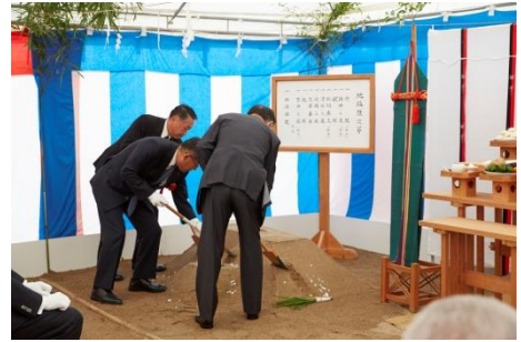
【穿ち初めの儀を行う共同事業主】