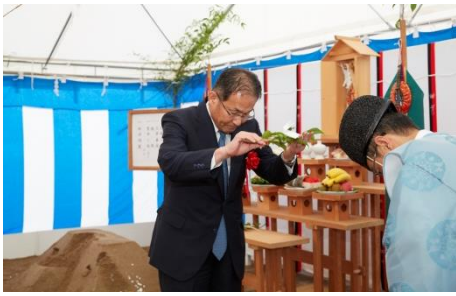
【玉串奉奠を行う 近鉄不動産(株) 赤坂社長】