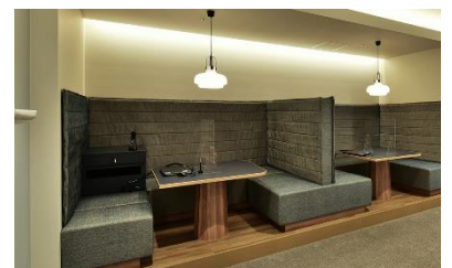
ソファボックス席(イメージ)

新店舗では、これまでの接客スタイルを見直し、ゆっくりとご相談を希望されるお客様へはカウンター越しではなく、ソファボックス席をご案内。お急ぎの方には専用カウンターでスピーディな対応をいたします。