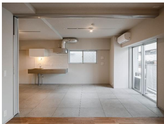
【Cタイプ (室内・タイル)】