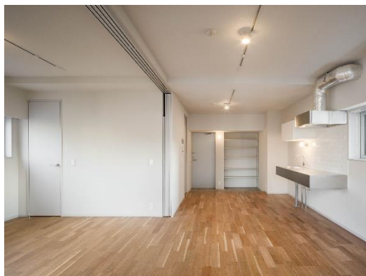
【Cタイプ (室内・フローリング)】