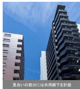
【周辺建物への配慮と「2つの顔」をもつ外観デザイン】