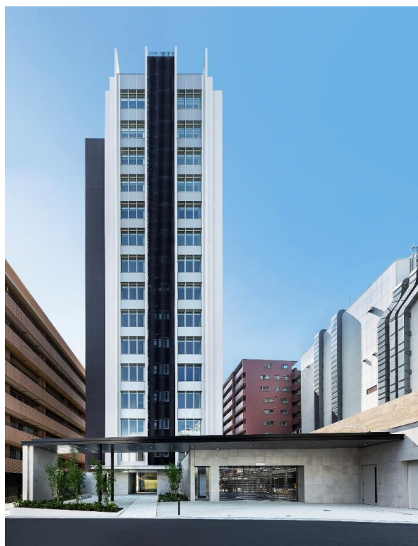
【ローレルアイあべの 外観】

これからも、「人と街の可能性を拓く。」というコーポレートステートメントのもと、総合デベロッパーとして、「ローレルマンションシリーズ」をはじめ、今後も多くのお客さまに愛される、快適で豊かな住まいや街づくりに努めてまいります。