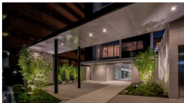
【エントランスアプローチ】