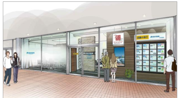
【店舗完成予想パース】