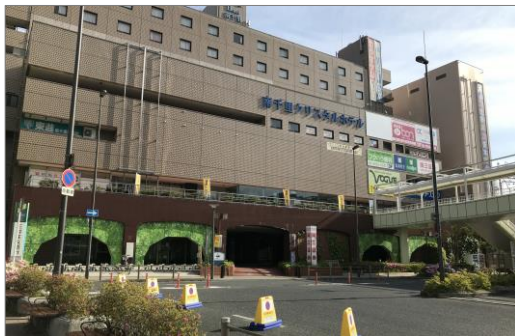
【店舗入居ビル 外観】