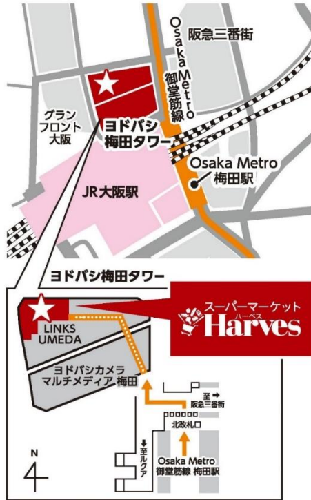
(7) 当店へのアクセスマップ