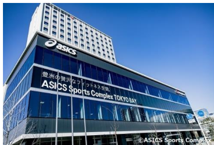
ASICS Sports Complex TOKYO BAY