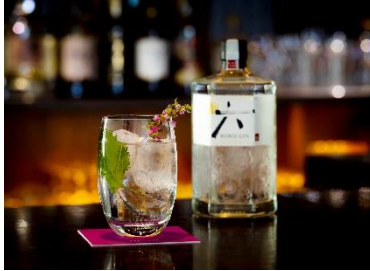
【七福ジントニック イメージ画像】