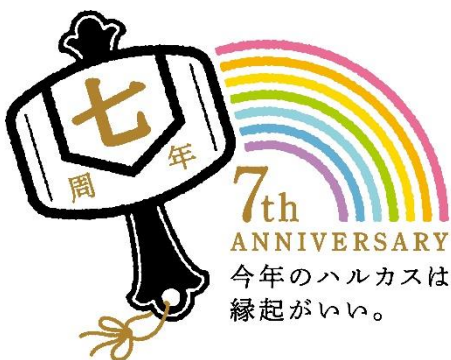
【7周年ロゴデザイン】

7周年を迎えるあべのハルカスは、本イベントを皮切りに、人のこころを晴るかす、様々なイベントを実施いたしますので、どうぞご期待ください。