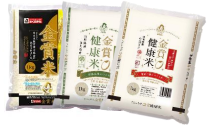
【米俵 イメージ画像】