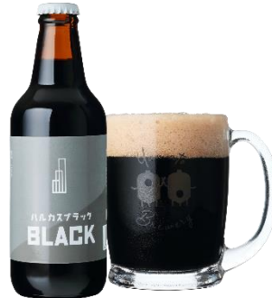
【ハルカスブラック】