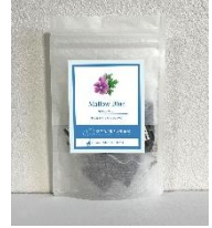
【マジックハーブ「マローブルー」】

■青く煌めくマジックハーブ「マローブルー」 600円(税込) お湯を注ぐと美術館ロゴのブランドカラーの鮮やかなブルーに染まります。 ご自宅で展覧会を振り返りながらほっとひと息。 見て楽しい、飲んでおいしい、不思議なハーブティーをお楽しみください。