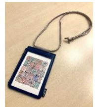
【オリジナルスマホショルダー】

■オリジナルスマホショルダー 1,980円(税込) スマホやコインロッカーの鍵などを収納できる便利なショルダー。 透明のポケット部分はポストカードを収納できるサイズになっています。 お気に入りの作品のポストカードを入れてお楽しみください。