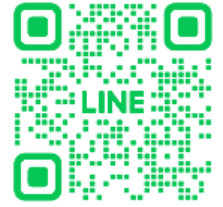
【あべのハルカス美術館【公式】 友だち追加QRコード】

当館をより身近に感じていただくことを目的に、公式LINEアカウントを開設いたします。展覧会や関連イベント情報、登録者限定の割引クーポンなどを配信するほか、スタンプカード機能も搭載いたします。