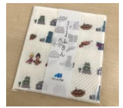
【あべのハルカス美術館 オリジナルふきん】

10周年を迎える3月7日(木)当日に「円空一旅して、彫って、祈ってー」にご来館のお客様にもれなく10周年を機に製作した「あべのハルカス美術館オリジナルふきん」をお1人様につき1枚、プレゼントいたします。