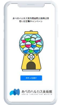
【デジタルガチャイメージ】