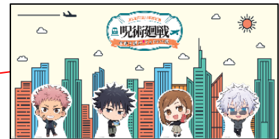
【デフォルメパネル】