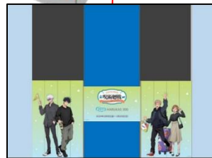
【エレベーター装飾（60階）】