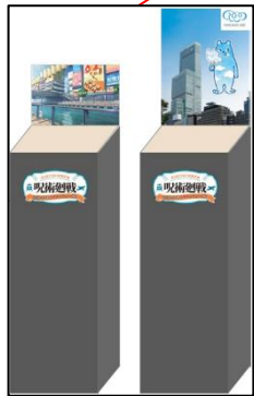
【ぬい撮りコーナー】