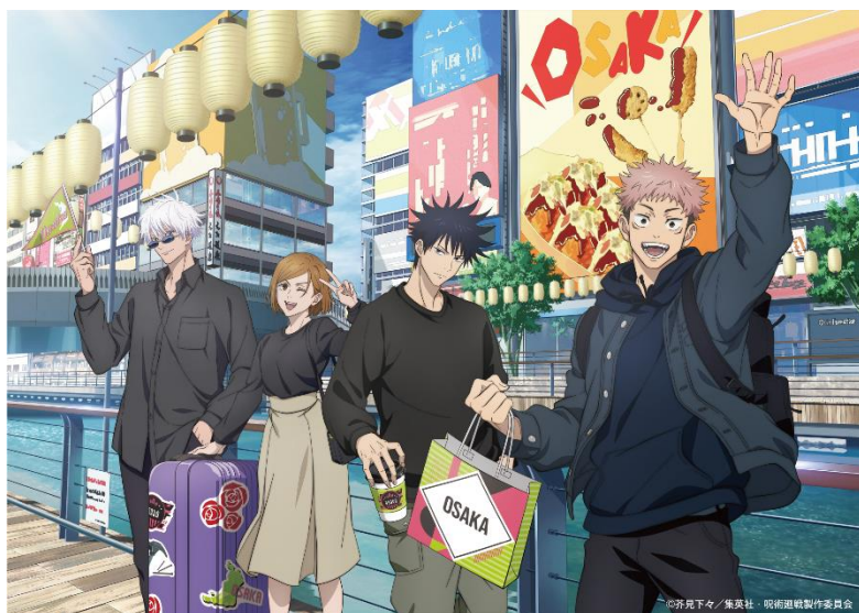
【本イベント限定オリジナル描き下ろしイラスト】