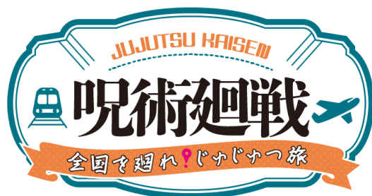
【本イベントロゴ（イメージ）】