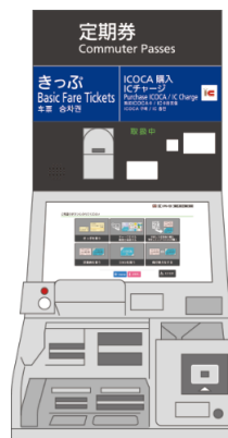
定期券自動発売機