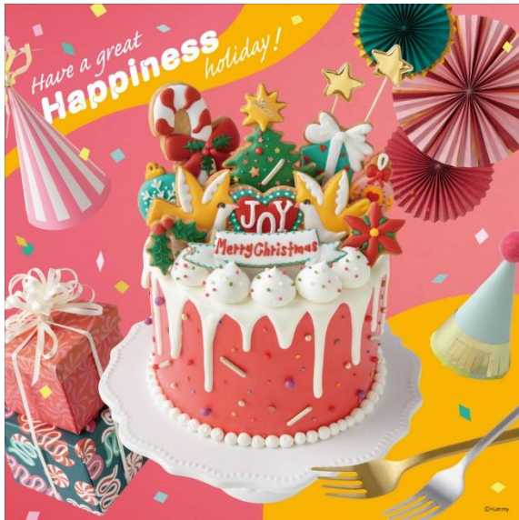
2023 近鉄のクリスマスフェア メインビジュアル ケーキバージョン

メインビジュアルは、クリスマスフェア期間中のショッピングバッグや、店内装飾に使用し、来店されたお客様にスペシャルでハッピーなクリスマス気分を楽しんでいただきたいと思います。