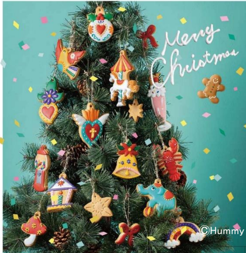
2023 近鉄のクリスマスフェア メインビジュアル ツリーバージョン

あべのハルカス近鉄本店では、「 Have a great happiness holiday～最高にシアワセなクリスマスにしよう！～ 」をテーマに、 コロナ後初のクリスマスに特別な体験をしていただける参加型のクリスマスイベントを強化して展開 します。108 個の「光の箱」でツリーを作る企画やハルカス 300 との連携イベントも開催し、来年 10 周年を迎えるあべのハルカスでのクリスマスを盛り上げます。