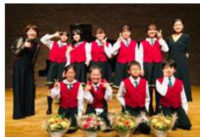
「あべのハルカス少年少女合唱団」過去のイベント時の画像

※プログラムの詳細につきましては、あべのハルカス近鉄本店 HP にて順次お知らせいたします。