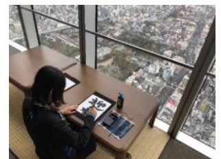
【書き初め体験イメージ】