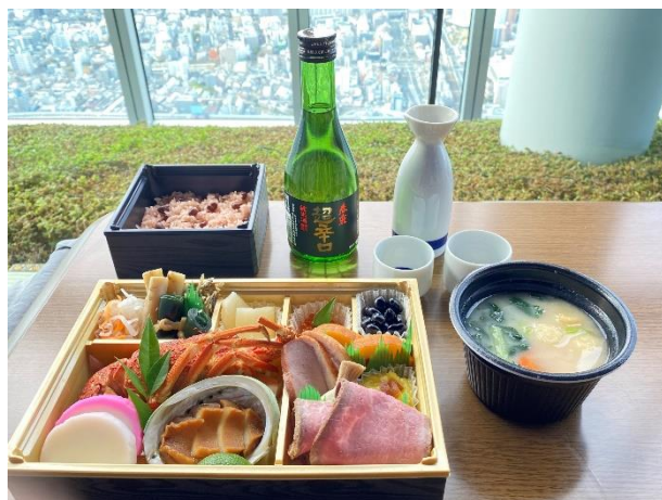
【「プレミアムプラン」おせち料理】