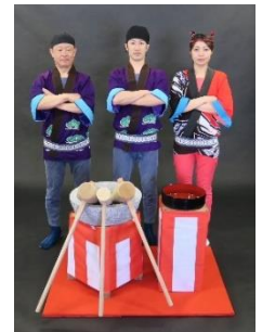
【餅つきイベントイメージ】