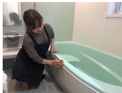
毎月訪問の家事代行サービスなどを提供