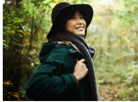
(ひとり旅イメージ)

【参考】動画でみる「ひとり旅」ツアー https://youtu.be/Vwnsnlgu0q8?si=TocX6RgsXrbKmWo4