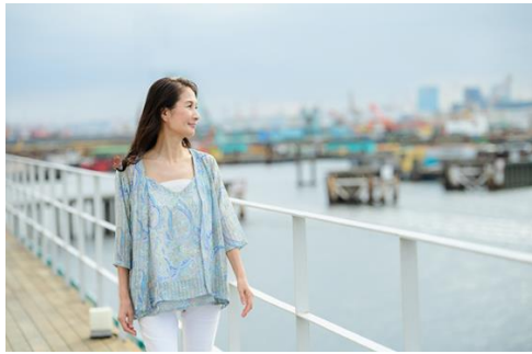
(ひとり旅イメージ) ひとり旅に関心はあるものの、未経験で不安のある方にも、“入門編”としてもお薦めです