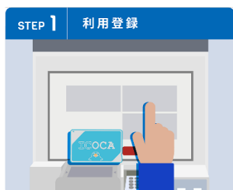
お手持ちのICOCAを定期券自動券売機で利用登録

なお、2024年2月29日（木）をもって、一部を除く回数乗車券の発売を終了します。 詳細は別紙のとおりです。