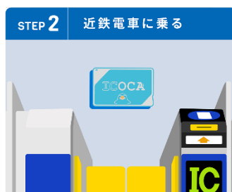
ご登録いただいたICOCAで近鉄電車に乗ってポイントをためる