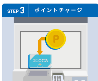
定期券自動券売機にて、ご登録いただいたICOCAに1ポイント1円でチャージ