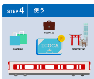
チャージされた電子マネーを電車・バスの乗車、お買い物等に使う